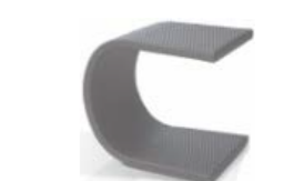
2985 Стол для лежака Aux. table