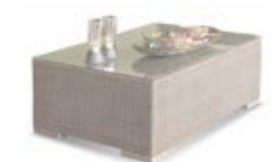
2004 / 2014 Журнальный стол Coffee table