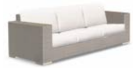
2003 / 2013 Трехместный диван Sofa