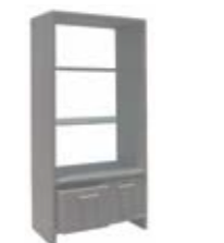
2388 Витрина Display cabinet