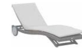
2984 Лежак Lounger