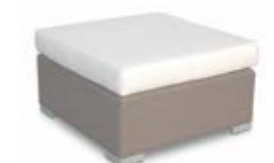
2006 / 2016 Банкетка Ottoman