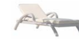
22852 Лежак Lounger