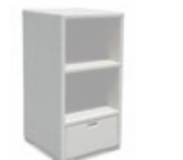
2139 Витрина Display cabinet