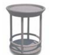
2990 Сервировочный стол Trolley