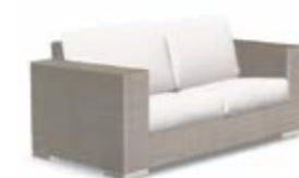
2002 / 2012 Loveseat Двухместный диван