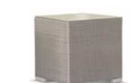
2005 / 2015 Приставной стол Side table