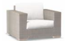
2001 / 2011 Кресло Armchair