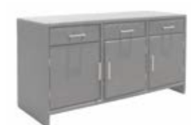
2390 Буфет Sideboard