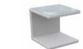
2935 Стол для лежака Aux. table