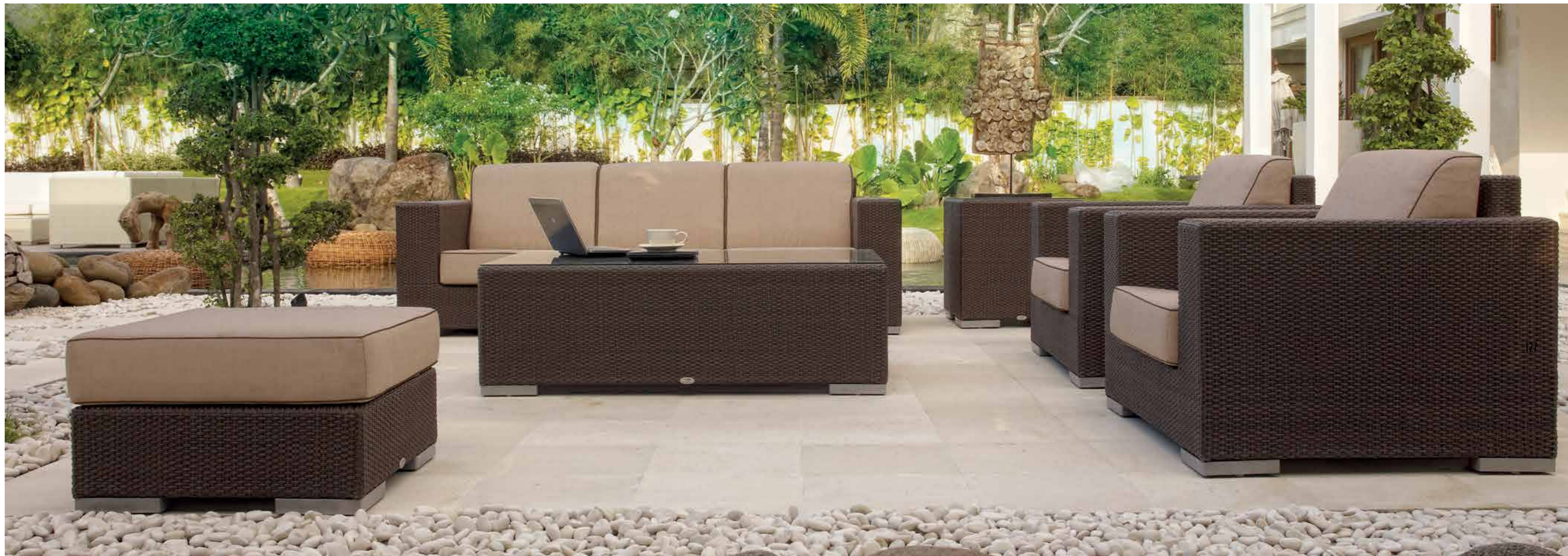
Гостиная группа CUATRO в отделке MOCCA